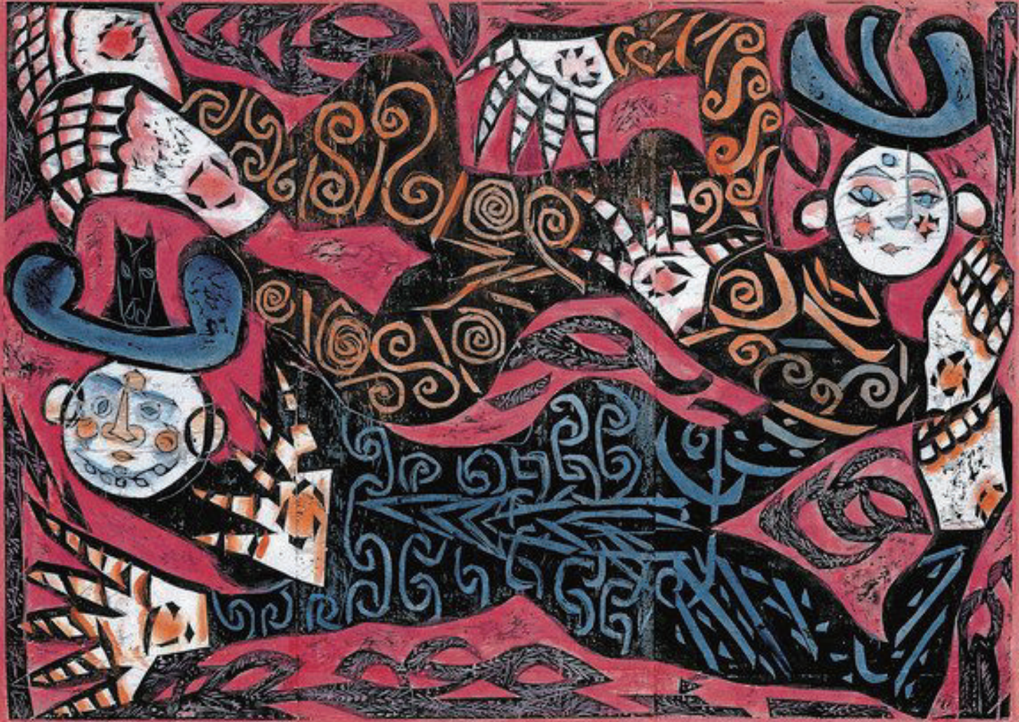
棟方志功《飛神の柵》 1968年 棟方志功記念館